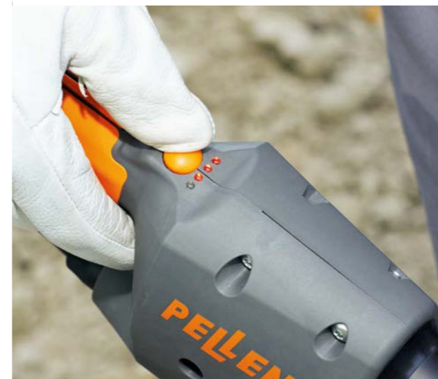
Sélecteur 4 vitesses