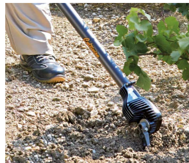
Travail de précision entre les cepes