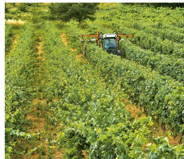
Écimez jusqu'à 10 km/h sans encrassement

L'écimeuse 2 rangs assure un écimage de qualité pour vos vignes grâce aux coupes franches des couteaux rotatifs. Le positionnement avant ou arrière de l'outil garantit une excellente vision sur le rang afin d'écimer en toute liberté. Un modèle étroit et un modèle large sont disponibles pour répondre efficacement à toutes les configurations de vignes.