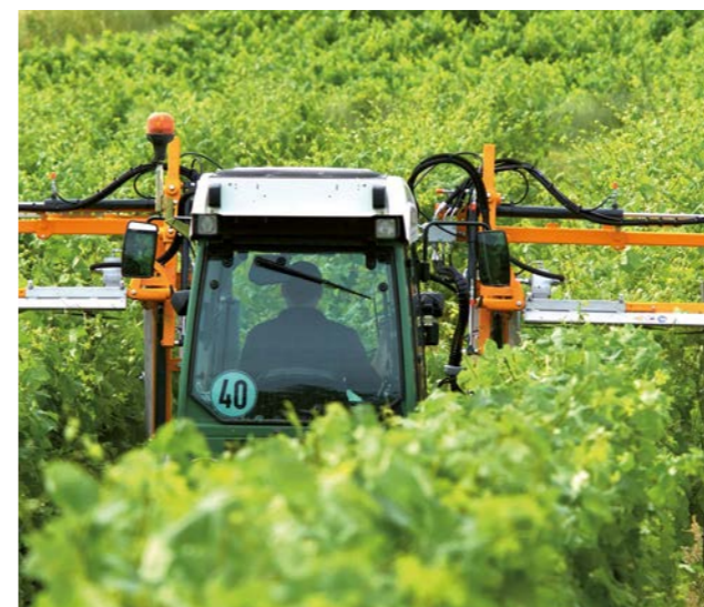
Écimage de qualité sur 2 rangs complets