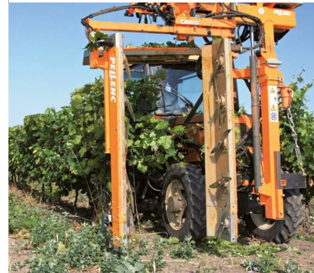
Travail rapide et précis dans toutes les configurations de vignoble