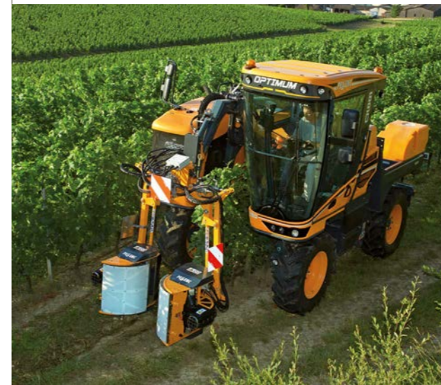
Effeuilleuse rang complet sur porteur OPTIMUM

ETA ROMAIN PASCAL Région Bordeaux - SAINT-ÉMILION - FRANCE