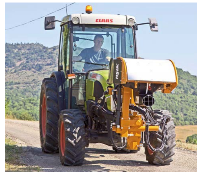
Transport facile et confortable