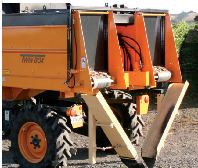
Épandage localisé au pied du rang