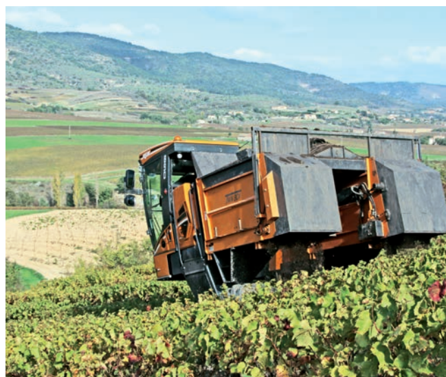
Excellente maniabilité en vigne