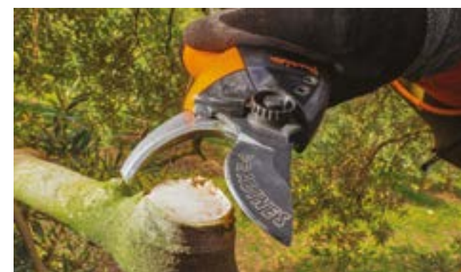
Tête de coupe Pellenc-Pradines