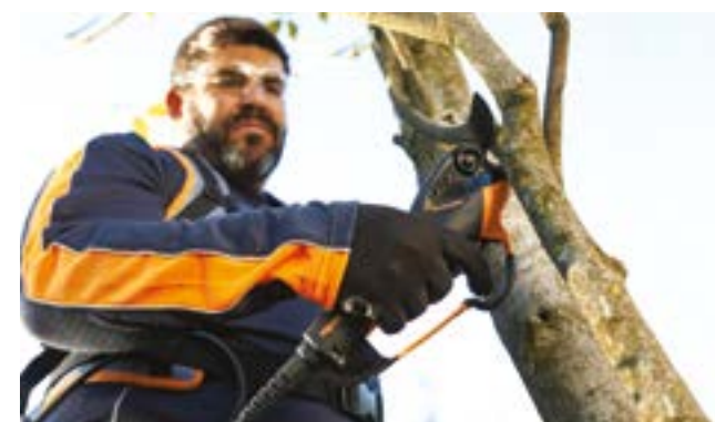
Ergonomique et léger